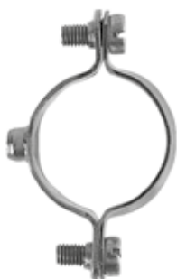
Collare distanziatore per tubi