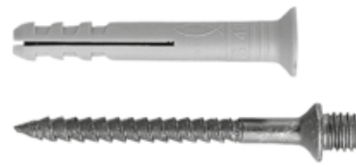
Fissaggi per collare distanziatore per tubi N 6-40 DV