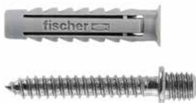
Fissaggi per collare distanziatore per tubi SX 6 DV