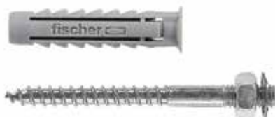
Fissaggi per collare distanziatore per tubi SX 8 DV